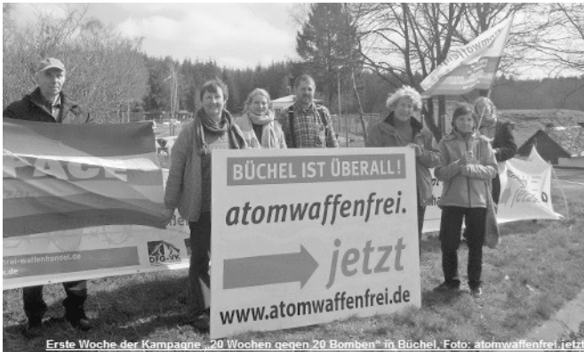
Erste Woche der Kampagne „20 Wochen gegen 20 Bomben“ in Büchel.

Am Dienstag, 9. August 2016 , dem 71. Jahrestag des Atombombenabwurfs auf Nagasaki , beschließt die Kampagne „Büchel ist überall - atomwaffenfrei jetzt!“ die 20-wöchige Aktions-Präsenz. Gleichzeitig endet damit die internationale Fastenaktion des internationalen Versöhnungsbunds und das internationale Jugendworkcamp der Pressehütte Mutlangen in Büchel.